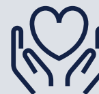
granty i darowizny na cele charytatywne