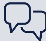
les matériels pédagogiques