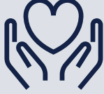
المنح والتبرعات الخيرية